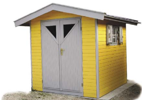
Peinture sur modèle en panneaux