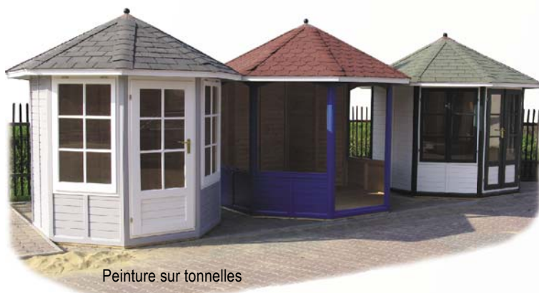
Peinture sur tonnelles